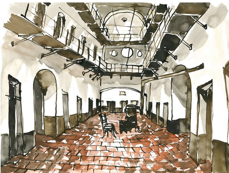
Peinture de Patrick Pleutrin, 2011

3°) Décrivez les différents lieux observés. Quelle impression en ressort-il ?