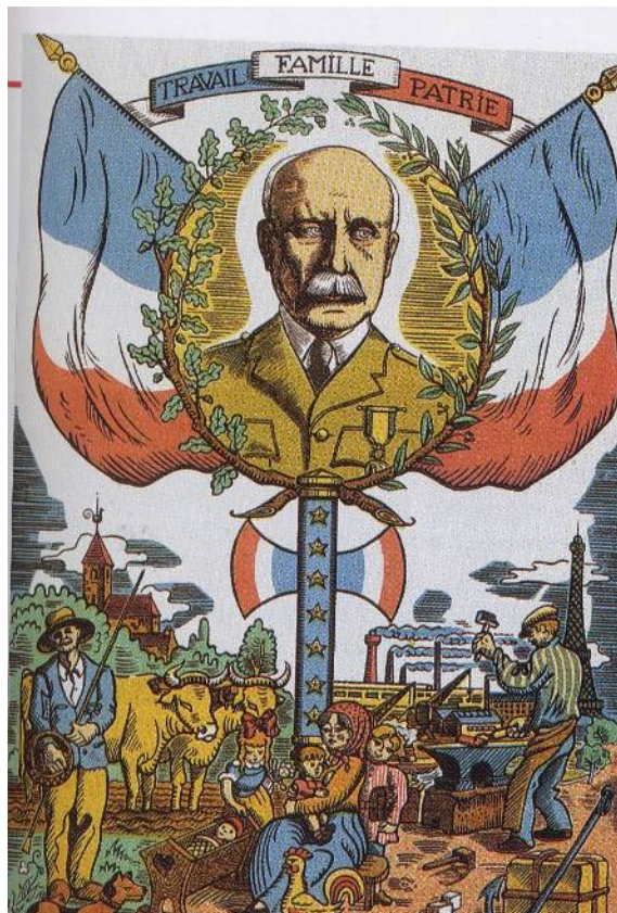
Affiche de propagande du gouvernement de Vichy, 1942

Révolution nationale : programme mis en place par le régime de Vichy en 1940, symbolisé par la formule « Travail, Famille, Patrie ».