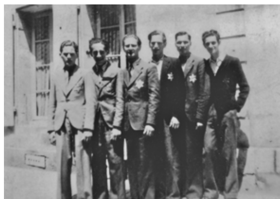
Lycéens juifs à Niort