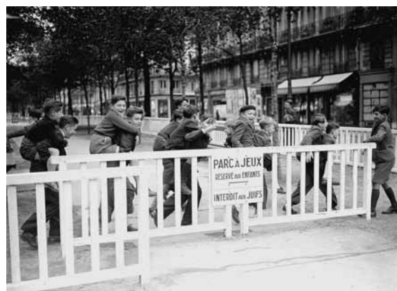
La 9 e ordonnance allemande interdit aux Juifs de fréquenter les lieux publics. Ici, à Paris, parc à jeux interdit aux Juifs – Novembre 1942

Les mesures d'exclusion se radicalisent jusqu'au printemps 1942 privant les Juifs des droits les plus élémentaires, les excluant de la vie économique et leur confisquant leurs biens privés. Le 2 nd statut juif promulgué par le régime de Vichy le 2 juin 1941 renforce l'exclusion économique. Désormais, les chefs de famille sont totalement exclus de la vie économique et mis au ban de la société. Pour assurer la subsistance quotidienne, le recours au travail clandestin et aux œuvres de bienfaisance juive est le lot commun. La 8 e ordonnance allemande du 29 mai 1942 impose en zone occupée le port de l'étoile jaune pour toute personne juive âgée de plus de 6 ans. La propagande antisémite désigne les Juifs ennemis de la société.