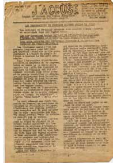
Avec cette feuille clandestine, le Mouvement National contre le Racisme mobilise l'opinion publique pour que se développe l'action des réseaux de sauvetage - octobre 1942

« Pour un enfant, au Noirvault, c'était la liberté. Je me promenais. J'accompagnais les vaches dans les champs. Le matin, c'était de grandes tartines de beurre salé. J'étais aimé par tout le village. »