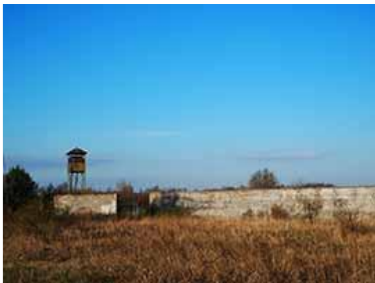
© Marie Rameau /// Ravensbrück, mur d'enceinte et mirador - avril 2015

Exposition de Marie Rameau à la Librairie Maupetit Les françaises à Ravensbrück – Souvenirs du 6 au 20 novembre