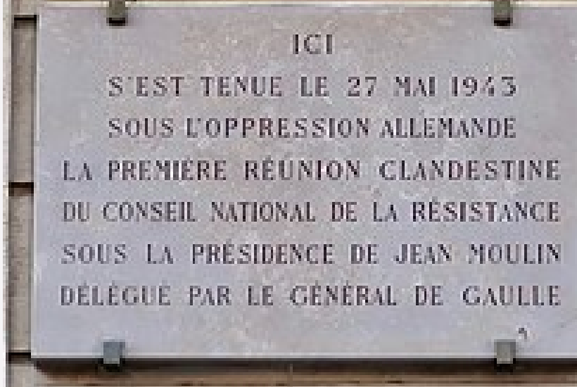
Plaque 48 rue du Four (6e arrondissement de Paris) commémorant la première réunion clandestine du CNR, le 27 mai 1943.

Des ressources en ligne utilisables par les enseignants et leurs élèves pour aborder le CNR en classe.