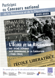
Affiche et couverture de la Brochure (Lettre de la Fondation de la Résistance n°111 septembre 2022) du CNRD 2022-2023

Formations CNRD : en décembre, l'équipe de la Fondation est intervenue à Annecy (Savoie), Gonesse (Val d' Oise), Laval (Mayenne), Laon (Aisne), Reims (Marne). En janvier, elle participera à celles organisées à Caen (Académie de Normandie), Poitiers, Toulouse.