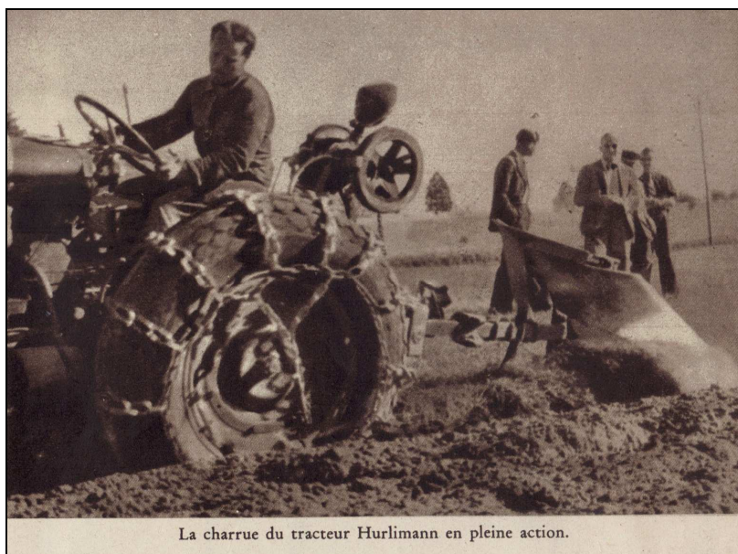
L'Illustré , revue hebdomadaire, Lausanne, Suisse, n°43, novembre 1945, 24 pages.

Paul Bourquin, le reporter de L'Illustré 18 , note que les tracteurs « Hurlimann » étaient sollicités 20 heures par jour ; des phares furent même installés pour pouvoir travailler à la tombée du jour. Les activités de bûcheronnage étaient également pourvues. Au mois de novembre 1945, 2 000 paires de chaussures furent envoyées aux bûcherons et aux paysans du Vercors 19 .