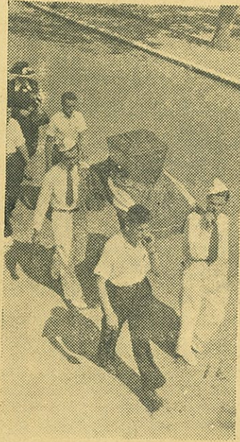
Les jeunes Villeneuvois portant l'urne au cimetière lors de la cérémonie de la remise des cendres à la population de Villeneuve-sur-Lot

Vos dénonciateurs , vos tortionnaires ? acquitté