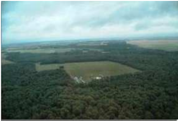
Terrain de La Brosse