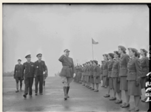
Le général de Gaulle passe les troupes en revue lors d'une cérémonie au centre d'instruction de Camberley. 31 mars 1943.