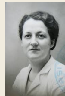
Germaine Tillion en 1930