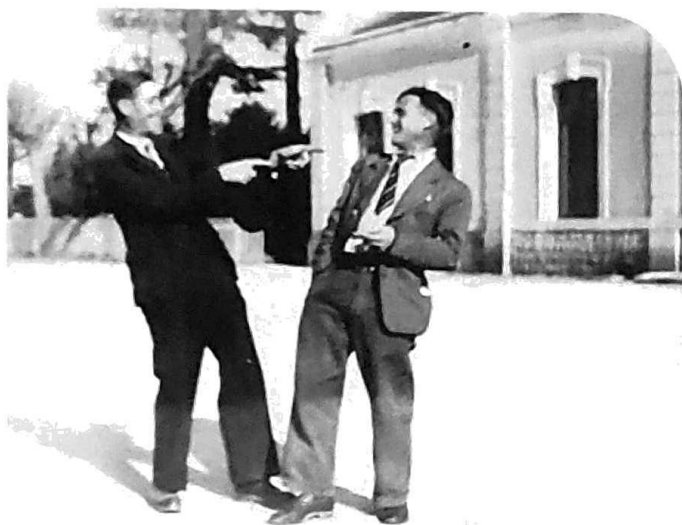
En compagnie d'un autre réfugié à St Julien

Il s'y convertira en salarié de la viticulture, y fondera une seconde famille et y demeurera jusqu'à la fin de ses jours.