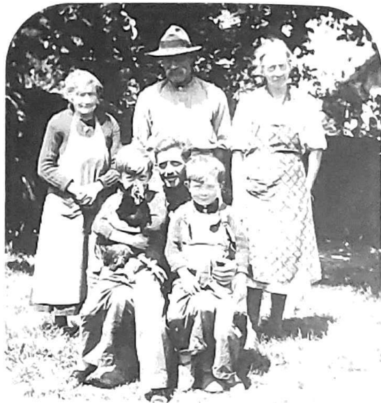
Au sein d'une famille d'accueil où il a trouvé 2 enfants comme ceux qu'il a du laisser en Espagne