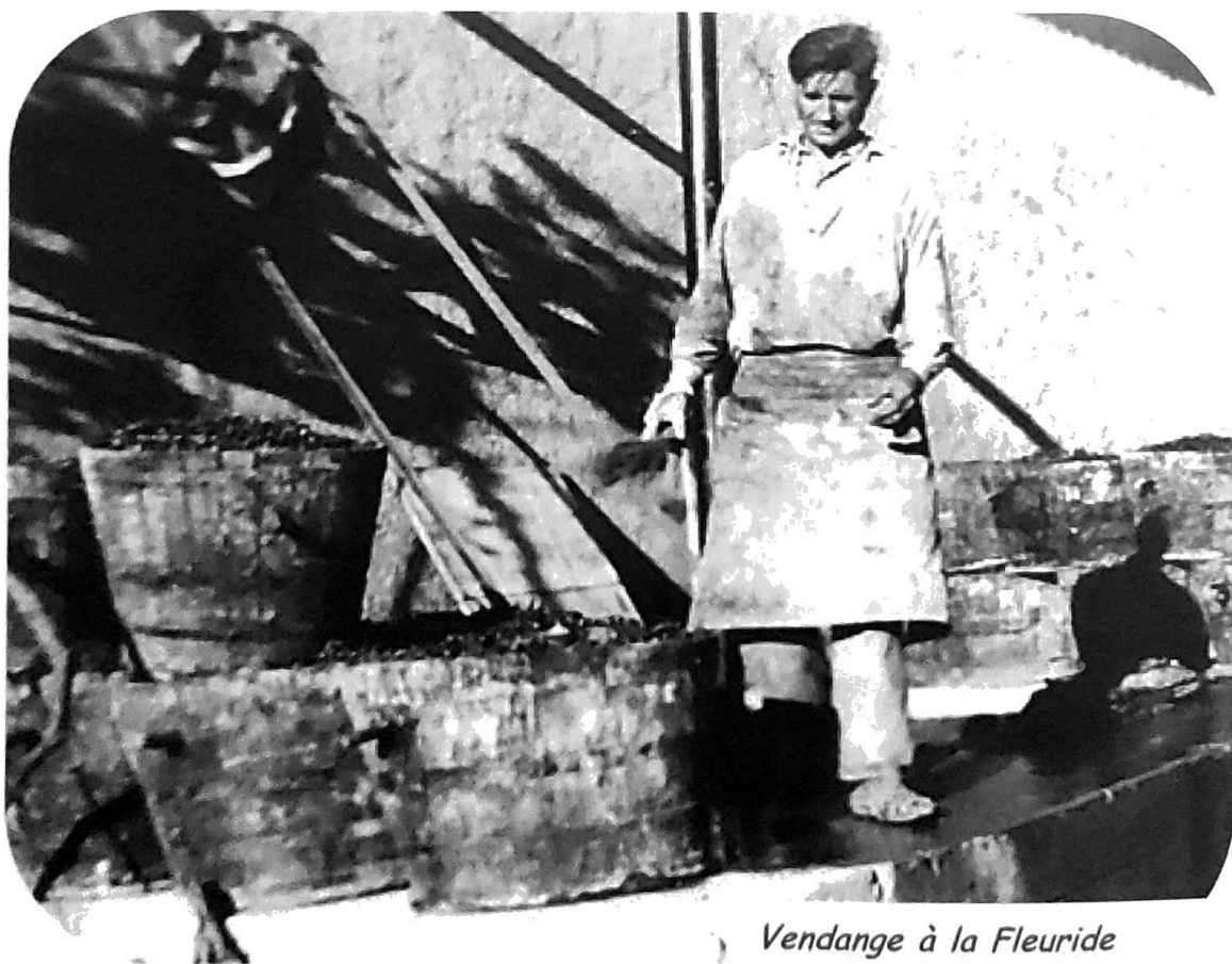
Vendange à la Fleuride