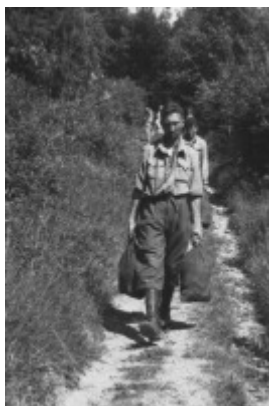
Coll. Mémoire de la Drôme Alias "Jacquelin"