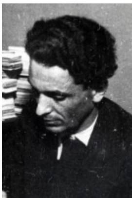
© Mémorial de la Shoah Alias "Edouard Kovalsky"